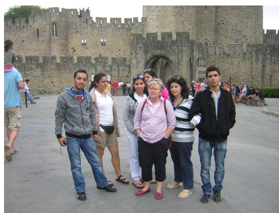
Visite à la Cité de Carcassonne