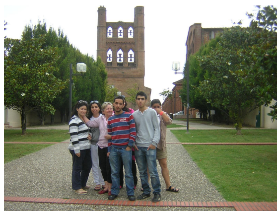
Devant l'église de Villefranche de Lauragais