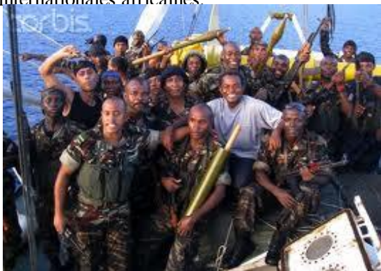
Commandos comoriens débarquant à Anjouan pour mater les rebelles.

Fin 2011, des barrages et barricades ont été dressés de façon incontrôlée sur 80% du territoire et des drapeaux français sont apparus un peu partout. Les forces comoriennes sont intervenues et ont procédé à des arrestations et déportations. Il faut rappeler qu'en 1976, la France avait consulté les Comores de façon globale et non île par île. Ensuite, seule Mayotte a été consultée. Or les Anjouanais ont toujours voulu rester français. En 1997, Anjouan a proclamé unilatéralement son indépendance et sa volonté d'être à nouveau rattachée à la France malgré les pressions internationales africaines.