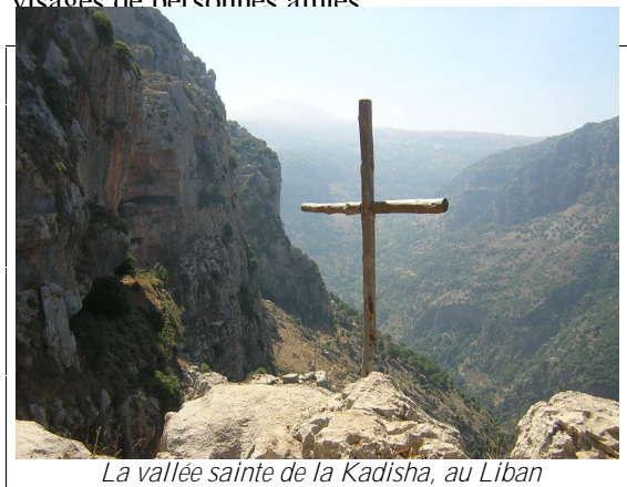
La vallée sainte de la Kadisha, au Liban