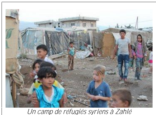
Un camp de réfugiés syriens à Zahlé

La maison a recueilli récemment 20 enfants réfugiés de Syrie, dont certains ont perdu leurs deux parents, et a pris en charge l'aide à cinq familles de réfugiés. Près de 500 familles sont ainsi arrivées aux alentours de Zahlé.