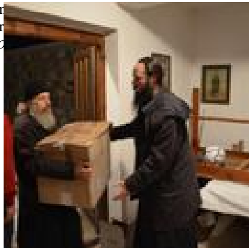
Moines serbes aidant au déchargement des colis de nourriture